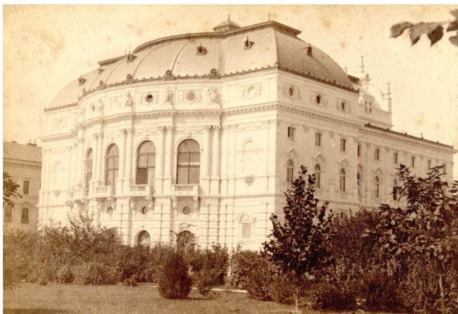
A szegedi kőszínház épülete, 1883

A fővárosban, a Nemzeti Színházban, a 19–20. század fordulóján a színjátszás felett megállt az idő. „ Süketfajdok uralkodnak itt. A lelketlen, különös, handabandázó, szavaló lények ” – írta Ady színjátszásunkról. 2 Ebbe az áporodott, megcsontosodott színészetbe vitt új életet Beregi a maga realista, a francia társalgási vígjátékok tapasztalatán csiszolódott színészetével. Tehetsége mellé a sors szerencsés külsőt is adott. Arányos alakja, szép feje, érdekes arca és kifejező, beszédes szeme volt. Hangja széles skálán, ércesen csengett. Nem csoda, hogy a századelőn, Budapesten fellépő Isadora Duncan 3 táncművész lánggra lobbant a jóképű, tehetséges fiatal színész iránt. Csathó Kálmán, 4 a Nemzeti Színház rendezője látta is őket együtt andalogni és később így írt erről: