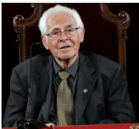
Tóth Sándor szobrászművész (1933–2019).

1962-ben, a kilencedik Vásárhelyi Őszi Tárlaton, sok egyéb műtárgy mellett Tóth Sándor Élet című alkotása is látható volt. A 65×35 centiméteres rézdomborításon egy várandós anya előtt térdelő férfi látható, aki gyöngéd csókot lehel asszonya áldott terhére. Fél évvel a kiállítás bezárását követően a Tornyai János Múzeum címére kézbesítenek egy Tóth Sándor szobrászművésznek küldött levelezőlapot, melyet Beregi Oszkár adott föl, Kaliforniában. Mivel a művész szegedi lakos, a múzeum igazgatója továbbítja a lapot a címzett Kálvin téri lakására.