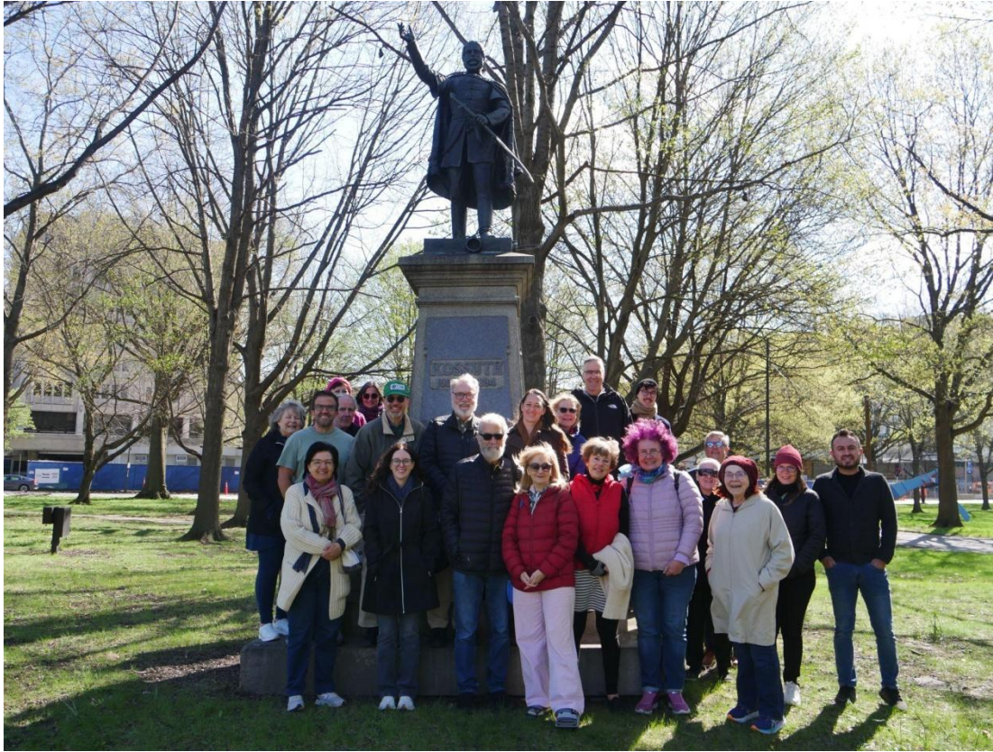
4. kép. Városnézés magyar szemmel. A képet Papp Klára készítette Fenyvesi Anna fényképezőgépével

Ezúttal sem maradt el a konferencia résztvevőiről készült csoportkép, mely a 2024-es konferencia alkalmával hagyományteremtő céllal készült először. Ezúttal a létszám akkora volt, hogy nem is fért mindenki a képre.