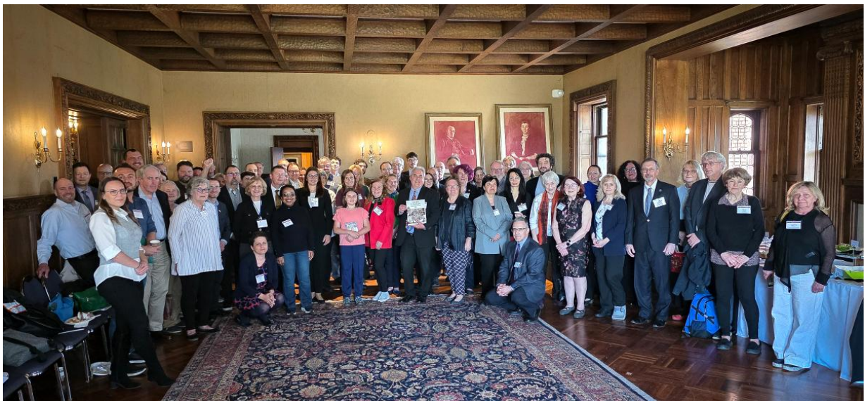
5. kép. AHEA-csoportkép.

Ezúttal sem maradt el a konferencia résztvevőiről készült csoportkép, mely a 2024-es konferencia alkalmával hagyományteremtő céllal készült először. Ezúttal a létszám akkora volt, hogy nem is fért mindenki a képre.