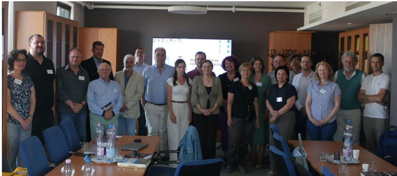
A júniusi workshop résztvevői

A második kerekasztal egy lehetséges kivándorlástörténeti kiállítás vagy múzeum kérdését vetette fel. A résztvevők azt vizsgálták, hogy milyen jelenlegi kihívások azonosíthatóak az amerikai magyar közösségek identitásának megőrzésében, milyen formában mutatható be az amerikai magyar életvilág a hazai muzeológia eszköztárával és milyen nemzetközi jó gyakorlatok kínálnak követendő példákat. A diskurzus során az is felmerült, miként lehetne összekapcsolni a hazai közgyűjtemények anyagait a diaszpórában őrzött családi gyűjteményekkel.