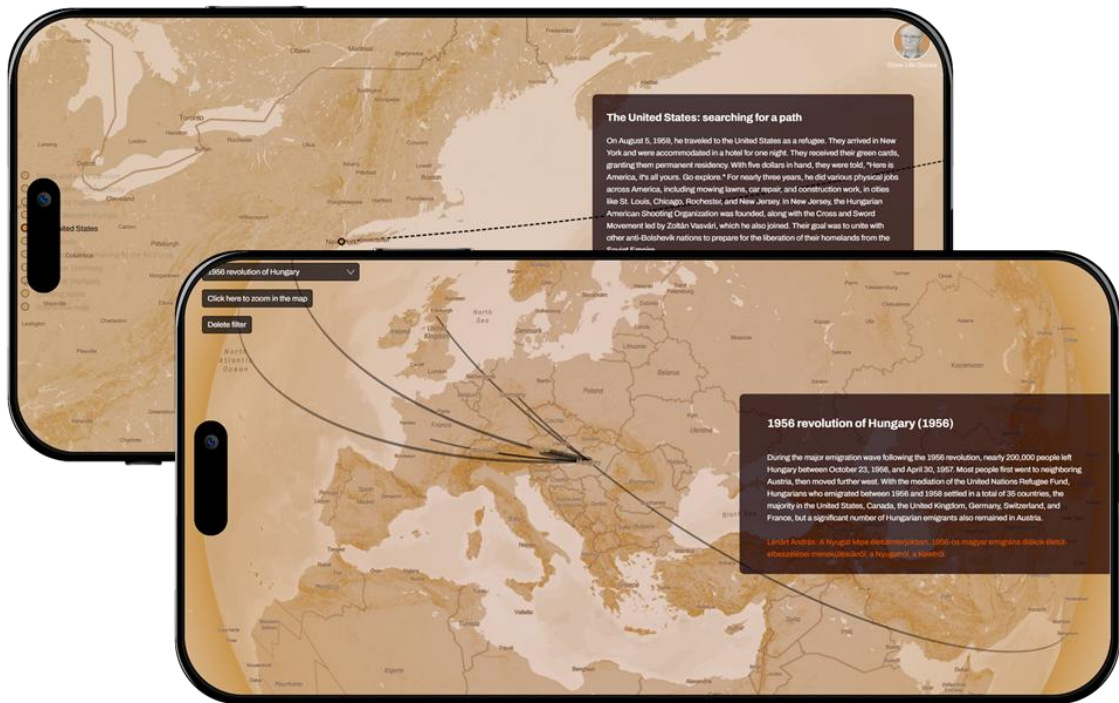
A virtuális kiállítás életútjait bemutató AToM platform

Az életutak és családtörténetek bemutatása a Magyar Nemzeti Levéltár vezetésével, az „Archives and Traces of Migration” (AToM) elnevezésű nemzetközi projektben kifejlesztett interaktív platformon történik. Az AToM platform egy digitális kiállítási felület, amely a migráció személyes történeteit vizuálisan, térképes alapon és forrásgazdagon teszi hozzáférhetővé. A világtérképre épülő felületen levéltári dokumentumok, fényképek, leírások és visszaemlékezések kapcsolódnak össze, kirajzolva a kivándorló életutak térbeli és történeti összefüggéseit.