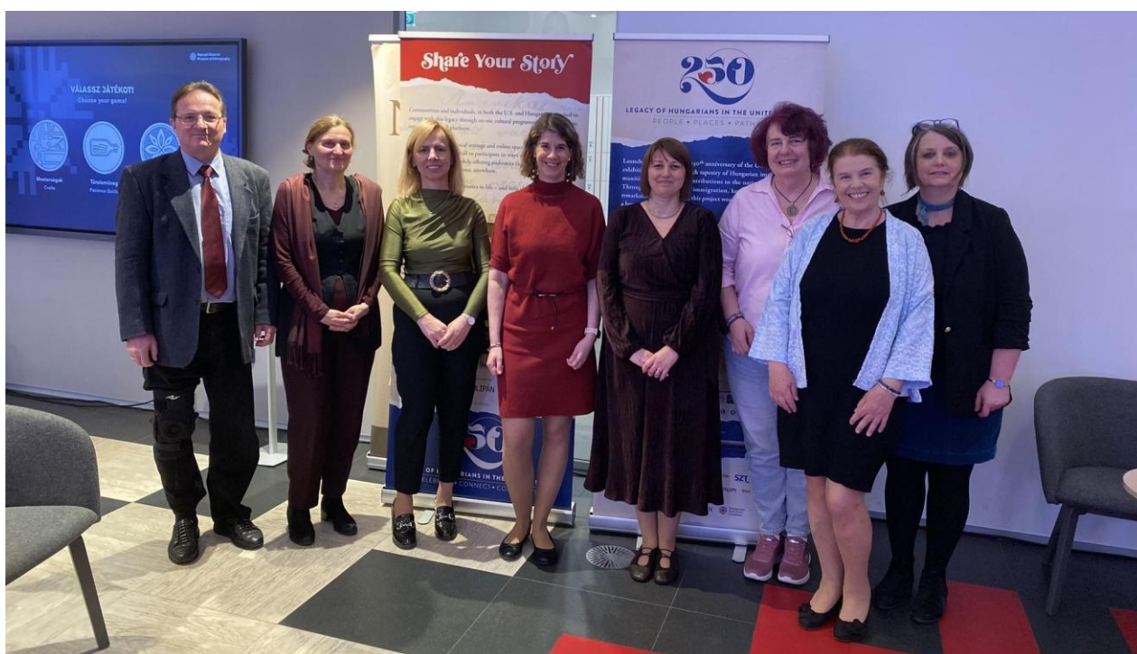
A Magyar Néprajzi Társaság által meghirdetett „Hazahozott álmok – Amerikás magyar emlékek és történetek gyűjtése” esemény előadói

A közösségi gyűjtés egyik fontos csatornája a Magyar Néprajzi Társaság által meghirdetett „Hazahozott álmok – Amerikás magyar emlékek és történetek gyűjtése” című pályázat, amely a kivándorlással és hazatéréssel kapcsolatos családi emlékek, történetek és tárgyak feltárását ösztönzi. A program keretében szervezett szakmai eseményen március 20-án a Néprajzi Múzeumban kutatók és gyűjtők közösen vitatták meg az amerikai emlékek dokumentálásának módszertani kérdéseit, valamint azokat a lehetőségeket, amelyek révén a családi emlékezetben fennmaradt történetek a tudományos kutatás és a közgyűjtemények számára is hozzáférhetővé válhatnak. A gyűjtés nemcsak a magyarországi kiállítási állomásokon és a kiemelt amerikai helyszíneken zajlik majd, hanem online felületen keresztül is, lehetőséget biztosítva arra, hogy a világ bármely pontján élő érdeklődők megoszthassák amerikai családi történeteiket és emlékeiket.