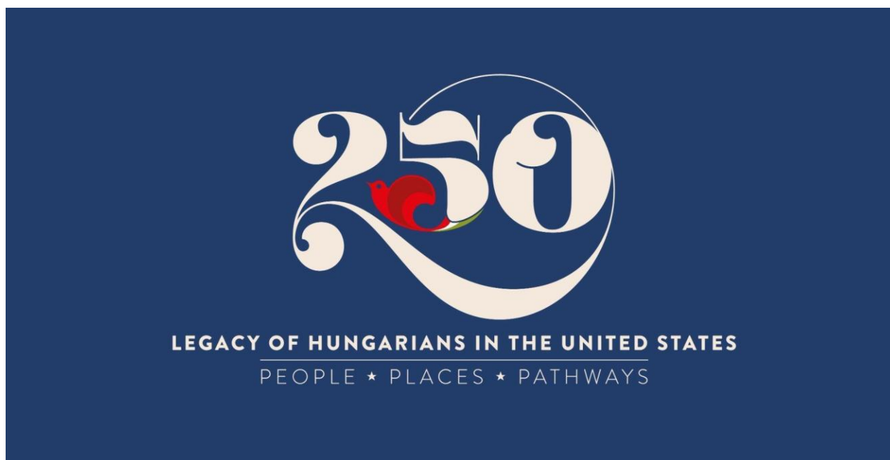
A kiállítás logója

Az Amerikai Egyesült Államok idei, 250. évfordulója, valamint az 1956-os forradalom 70. évfordulója kivételes lehetőséget kínál arra, hogy az Amerikába irányuló magyar kivándorlás történetét egy interaktív, kétnyelvű, és a jövőben tovább bővíthető kiállítási projekt keretében mutassuk be, amely egyúttal első lépése lehet egy intézményeket és kutatókat összefogó szakmai hálózat kialakulásának. A kiállítás célja, hogy egyetemek, levéltárak, könyvtárak, kutatóhelyek, múzeumok, valamint civil és közösségi kezdeményezések együttműködésében mutassa be a két ország történelmének közös pontjait és azok máig ható örökségét.