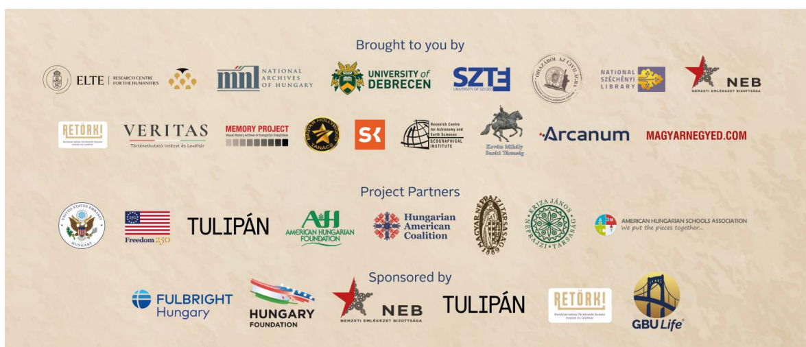
A kiállítás közreműködői, partnerei és szponzorai

A kiállítás megvalósítása több intézmény és szakmai műhely együttműködésének eredménye. A kezdeményezés motorját öt intézmény és program adja: a Magyar Nemzeti Levéltár, az ELTE Humán Tudományok Kutatóközpontja, a Debreceni Egyetem, a Szegedi Tudományegyetem, valamint az „ Óhazából az Újvilágba ” örökségprogram. A projekt megvalósításához számos partnerintézmény és szakmai együttműködő járul hozzá, akiknek részvétele nélkül a kezdeményezés nem jöhetett volna létre. Hálásak vagyunk mindazon partnereinknek és támogatóinknak, akik szakmai munkájukkal, erőforrásaikkal vagy anyagi támogatásukkal hozzájárulnak a projekt megvalósításához.