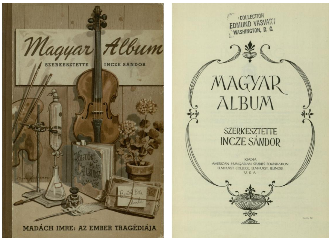
6. kép: Magyar Album