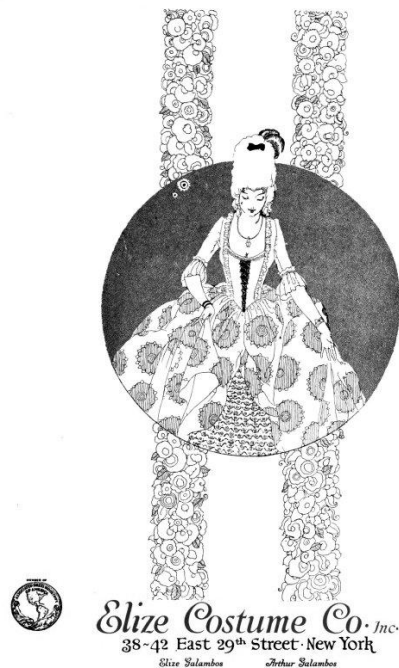
4. kép: Hirdetés. American Cloak and Suit Review , 19. 1920. (júniustól havonta)