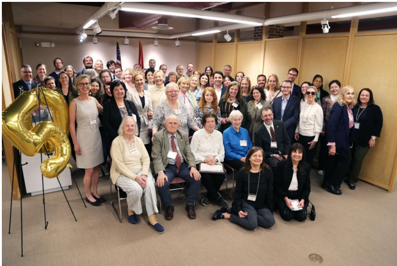
4. kép: AHEA-csoportkép.

A szakmai programon, kapcsolatépítésen, könyvkiállításon és az 1956–57-es Camp Kilmer menekülttábor ábrázoló poszterbemutatón kívül a színes és tartalmas esti programokon – a Fulbright Bizottság fogadásán, valamint a Magyar Amerikai Atléta Klub (HAAC) tavaszi bálján – egyaránt lehetőség nyílt a kötetlen beszélgetésekre, finom magyar ételek és borok fogyasztására, népzene- és néptáncbemutatóra, sőt még hivatalos csoportkép is készült, az AHEA történetében először, de reményeink szerint nem utoljára!