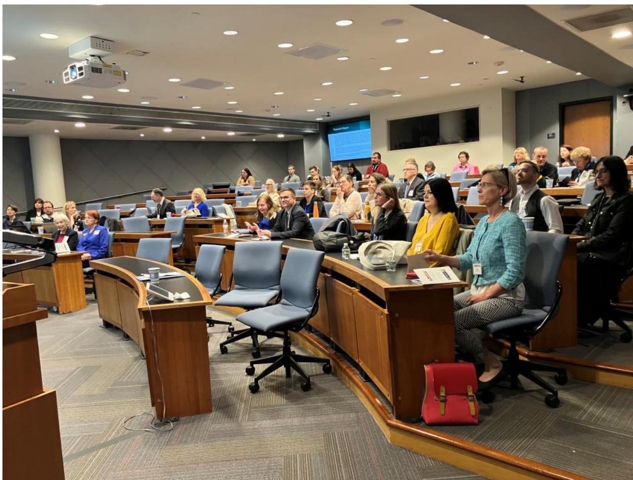
3. kép: A taggyűlés résztvevői.