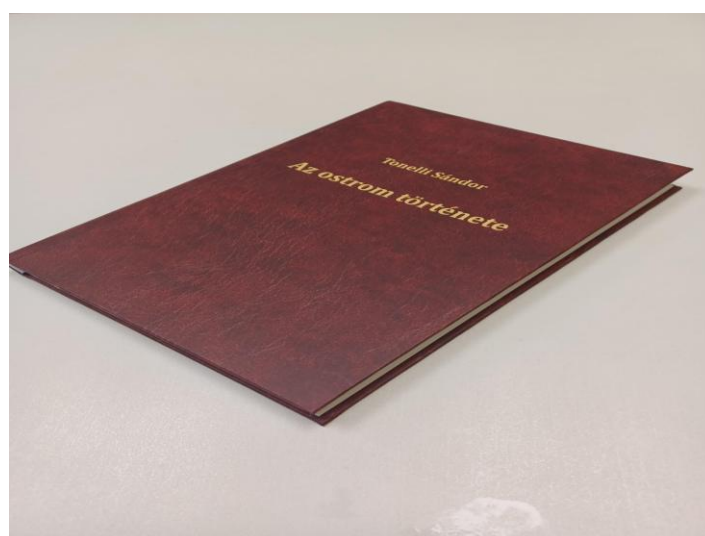
Tonelli Sándor: Az ostrom története

A könyv egy példányát szeretném a Vasváry Collection részére felajánlani és futárral önöknek hamarosan elküldeni. 4 További példányok nálam rendelkezésre állnak az esetleges érdeklődők számára.