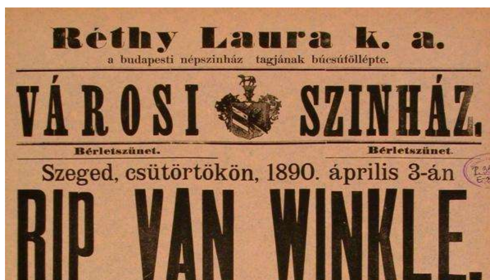
4. kép: Szegedi színlap. Somogyi-könyvtár, helyismereti gyűjtemény

Azzal odalépett hozzám és mindenki előtt homlokon csókolt.” 9