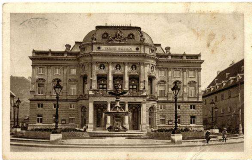
7. kép: Pozsony, Városi Színház.