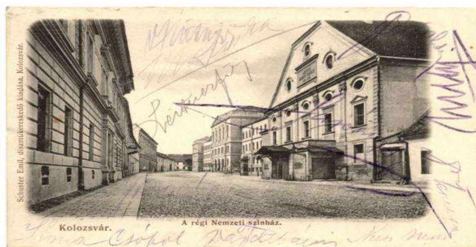
3. kép: A kolozsvári régi Nemzeti Színház.