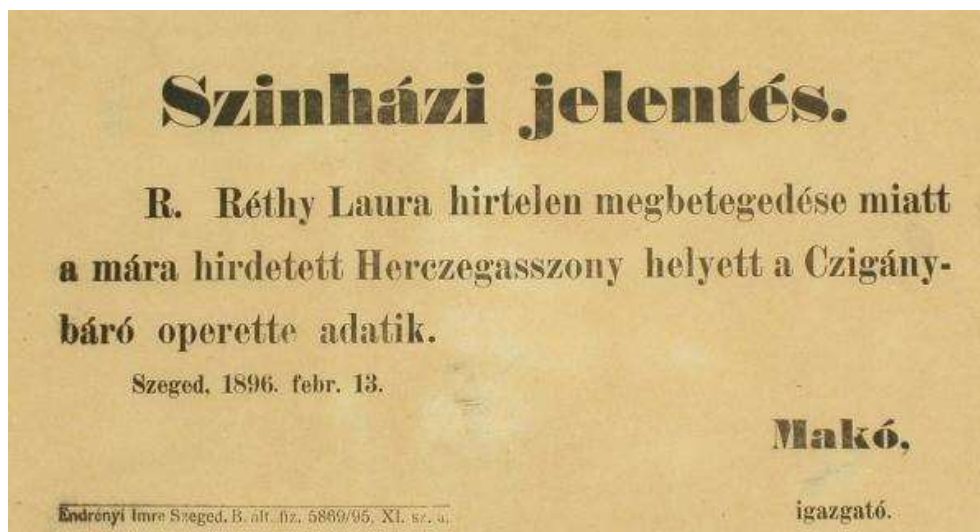
6. kép: Somogyi-könyvtár, helyismereti gyűjtemény

szerződési ajánlatának elfogadására. Terve sikerül, és Réthy Laura az 1895/96-os szezontól három évre a Szegedi Városi Színház tagja lesz.