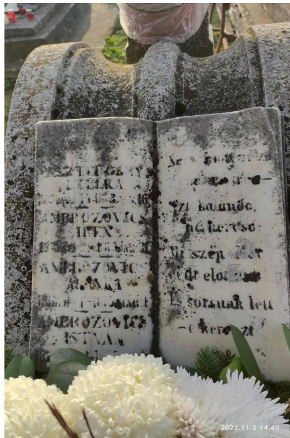
4. kép: Kopott felirat, mely a régmúlt időköt idézi