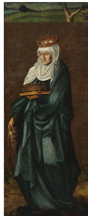
10. kép: Németalföldi festő, 1520 körül: Magyarországi Szent Erzsébet