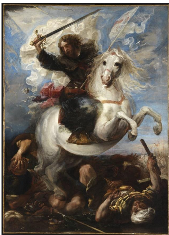
2. kép: Juan Carreño de Miranda (1614–1685): Id. Szent Jakab apostol legyőzi a mórokat

A műveket Boross leginkább az Egyesült Államokban, Angliában, vagy Hollandiában vásárolta. A gyűjteménye ékességeként tekintett a spanyol képeire, amelyek között a hét Murillo-festményére volt a legbüszkébb. Ezek közül egyet – bevallása szerint – ő maga fedezett fel: Londonban egy árverésen megakadt a szeme egy mellőzött, igen rossz állapotú, kisméretű portrén, amelyen a besötétedett firniszréteg alatt éppen hogy ki lehetett venni egy körgallért. A jelenlévőket csak a kerete érdekelte, Boross viszont meglátta benne az értéket, megvásárolta a képet, majd restauráltatta. A tisztítást követően előbukkant egy férfiképmás, amelyről August L. Mayer, Bartolomé Esteban Murillo monográfusa megállapította, hogy a kiváló 17. századi sevillai mester ecsetjétől származik, 8 hasonlóan egy másik, a Szent Családot ábrázoló képhez. 9