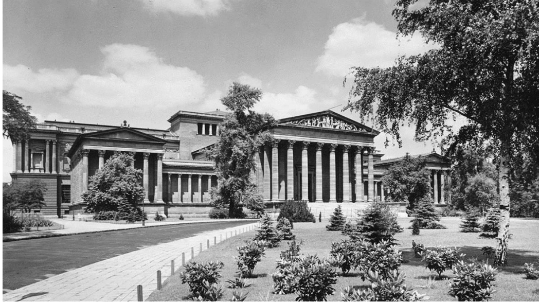
3. kép: A Szépművészeti Múzeum 1936-ban