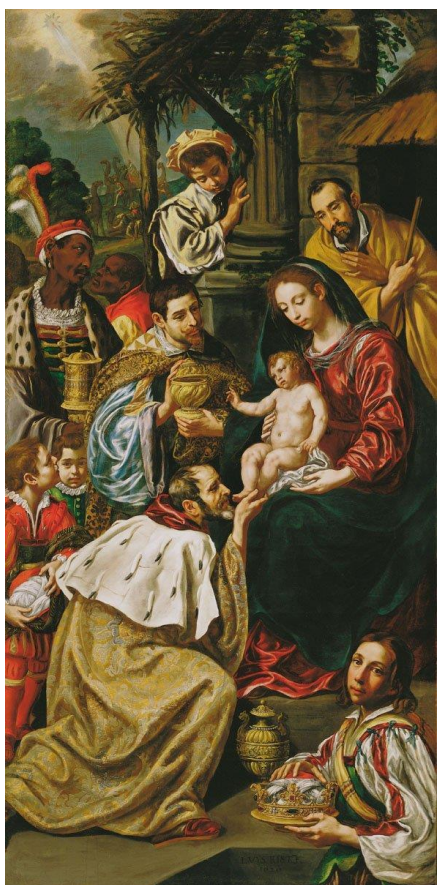
7. kép: Luis Tristán (1585–1624): A királyok imádása