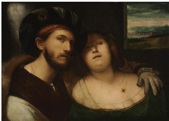
5. kép: Altobello Melone (1490 körül–1543): Szerelmespár