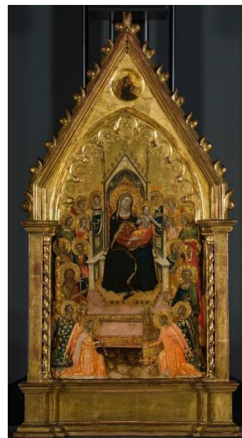
6. kép: Giusto de' Meabuo (1320/1330 körül–1391 előtt): Trónoló Mária gyermekével