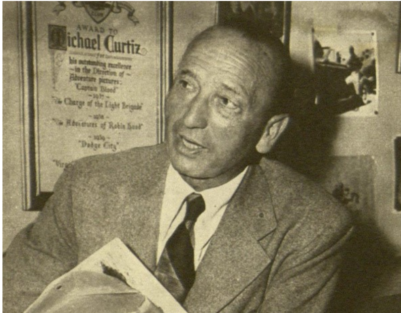
5. kép:

A hollywoodi filmrendező sorsa majdnem olyan, mint egy hadvezéré, akinek a tegnapi sikereit elfelejtik, ha nincs szerencséje ma is győzni... [...] Minden rendező itt nehezen verekszi ki a sikerét, és csak nehezen tudja megtartani az elért ranglétrát, mert – IT’S TOUGH TO BE ON THE TOP!” 33 Azaz nehéz fenn lenni!