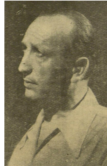
4. kép: Az Ember , 1943. október 23.

„Aki otthon érdemeket szerzett, arról a sajtó évek múlva is megírta, hogy ő az, aki ilyen vagy olyan dicsőséget ért el. De Amerikában, mely a rohanó élet forgatagába sodor mindenkit, kevesen ismerik el a múltnak járó respektust. Itt nincs szentimentalizmus, és holnap elfelejtik azt, aki ma sikert aratott, mert ITT CSAK ANNAK JUT LIMELIGHT 32 AKI A SIKERÉT ÁLLANDÓSÍTANI TUDJA, ami majdnem a lehetetlenséggel határos. [...] Amikor évek előtt Hollywoodba jöttem, és először vettem részt az Academy of Motion Picture Arts and Sciences bankettjén, ahol [...] kiadják az Oscar néven ismert kis aranyoszobrokat, valaki bemutatott Fred Niblonak, aki történetesen az estély ünnepi szónoka volt. De Niblo nemcsak mint Master of Ceremonies szerzett népszerűséget, hanem kitűnt mint Hollywood egyik legkimagaslóbb rendezője is. [...] Megismerkedésünkkor szószerint ezt mondtam neki: „Boldog vagyok, hogy kezdet foghatok olyan nagy emberrel, mint Ön, aki a Ben Hur-t alkotta”. Ez a nagytehetségű ember ma nem dolgozik, nincs szerződése, és visszavonultan a farmjából él. [...] Mert itt a tegnap hőst elfelejtik és eltemetik! [...]