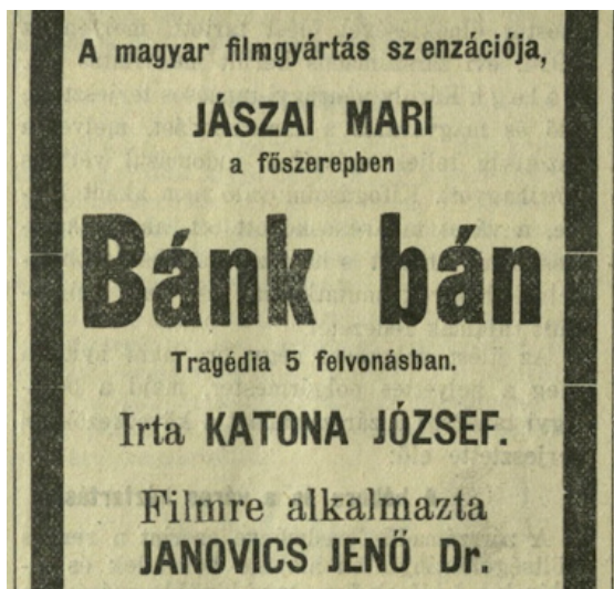
3. kép: Szegedi Napló, 1915. április 23.

De ne kalandozzunk el, térjünk vissza 1914-re. A Bánk bán felvételei július első felére befejeződtek. A film egyik különlegessége, hogy a mozgóképek közötti feliratok Katona József drámájának eredeti szövegei voltak. A közönség és a kritika is jól fogadta a filmváltozatot. „...értékes és sikerült vállalkozás volt, mert nemzeti tartalmat népszerűsít. [...]