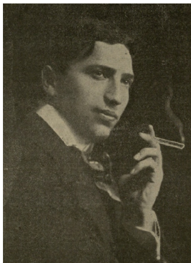
1. kép: Kertész Mihály. Az Idő, 1908. október

Kevesen tudják, hogy egy évszázada hollywoodi filmsillagok kápráztatták el a szegedi színház nagyérdemű közönségét. Igaz, akkor még senki sem gondolta – még a két későbbi sztár sem –, hogy milyen fényes karrier vár majd az akkor még pályájuk elején álló ifjú színészekre: Kertész Mihályra , aki Michael Curtiz néven a Casablanca című filmjével lett Oscar-díjas rendező, és Lugosi Bélára , akit „Drakula”-ként ismert meg a világ. Ismerkedjünk meg hát mi is kalandos életútjukkal! 1