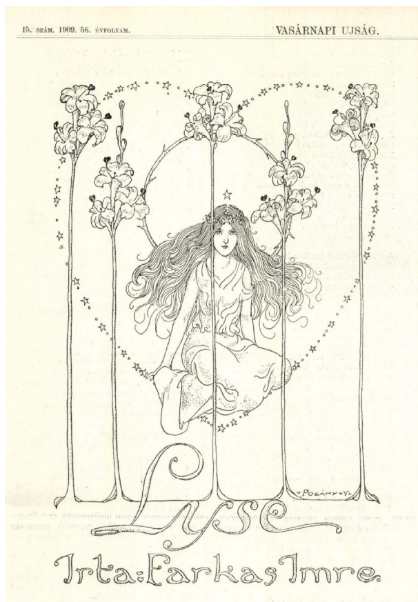
2. kép: Pogány Willy versillusztációja. Vasárnapi Ujság, 1900.

amerikai magyarságra vonatkozó lapkivágatait láthatják az érdeklődők a könyvtár földszinti kiállítóterében.