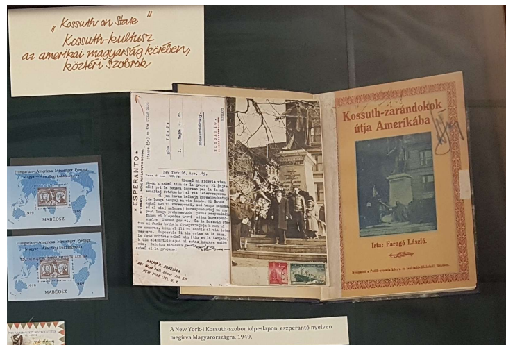
2. kép: Kossuth-kultusz az amerikai magyarság körében. A New York-i Kossuth-szobor tövében ünneplő magyarokat ábrázoló képeslap, esperantó nyelven megírva (1949)