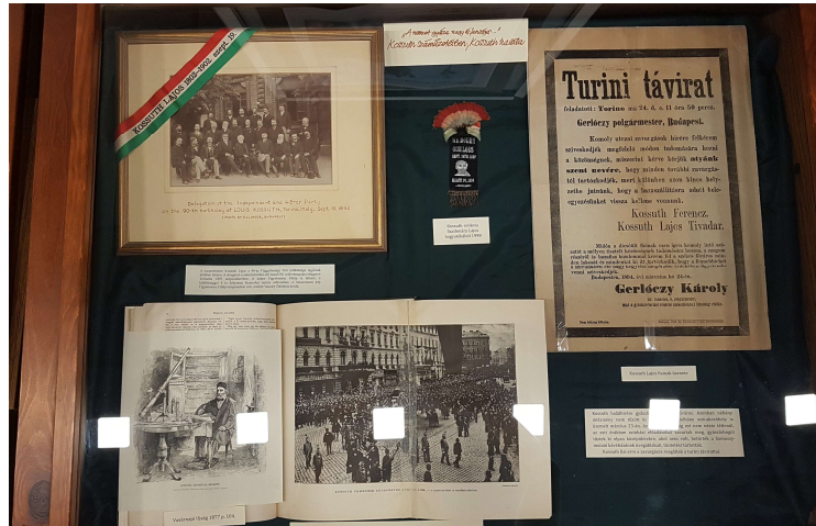
1. kép: Magyar küldöttség látogatása a turini remeténél, gyászszalag, a turini távirat és korabeli tudósítás a pesti gyászenetről, a gyászoló tömegről