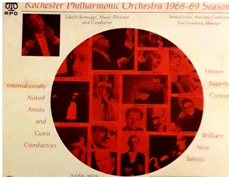
A Rochesteri Filharmonikusok fellépői az 1968–69-es koncertévadban