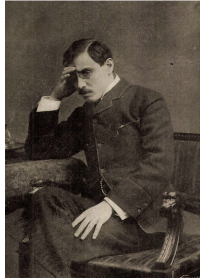
2. kép. Ország-Világ, 1895. november 17. (Arcanum Digitális Tudománytár)

Pablo Casalsban a komponista igaz barátira, műveit koncertpódiumra segítő muzsikusra talált. Az elkövetkező hat év – 1906-tól 1912-ig – Moór Emánuel zeneszerzői pályájának csúcspontját jelentette. Ezekben az években szimfóniái, gordonkaversenyei, hegedűszonátái és más zeneművei kitűnő művészek tolmácsolásában csendültek fel a világ számos hangversenytermében. Harmadik operája, a Hochzeitglocken is színpadot kapott 1908. augusztus 2-án Kasselben. 1911. január 26-án pedig Londonban, a „Savoy Színházban került színre Emanuel Moor magyar zeneszerző két operája, a Lakodalmas harangok 23 és a