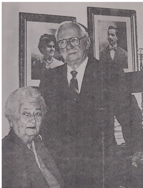
5. kép: A 60. házassági évfordulón (lásd: 14. lábjegyzet)

Az imént ismertetett, három embernek is elegendő életút mellett még egy területen kipróbálta magát: erdőgazdálkodási vállalkozásának sikerre vitele után szerzőként is bemutatkozott. Még 1942-ben, egy cserkésztalálkozó alkalmából kezdett el „furcsa és különleges definíciókat” gyűjteni. Ez a hobbija később is megmaradt, az 50 éven át folyamatosan gyűjtött vicces szómagyarázatokat szorgosan lejegyezte és katalogizálta is. Az ennek alapján készült könyv 1993-ban jelent meg, címe pedig Deft and Daft Dictionary volt. 19 Saját bevallása szerint ez volt az első és utolsó könyve, nem tervezte, hogy írói karrierbe is belekezd. Ide kapcsolódik, hogy lelkes gyűjtője és fordítója volt a magyar költészetnek, személyes iratai között sok klasszikus (pl. Petőfi-versek), de néhány kevésbé ismert magyar vers saját kezűleg fordított angol változata is megtalálható. 20