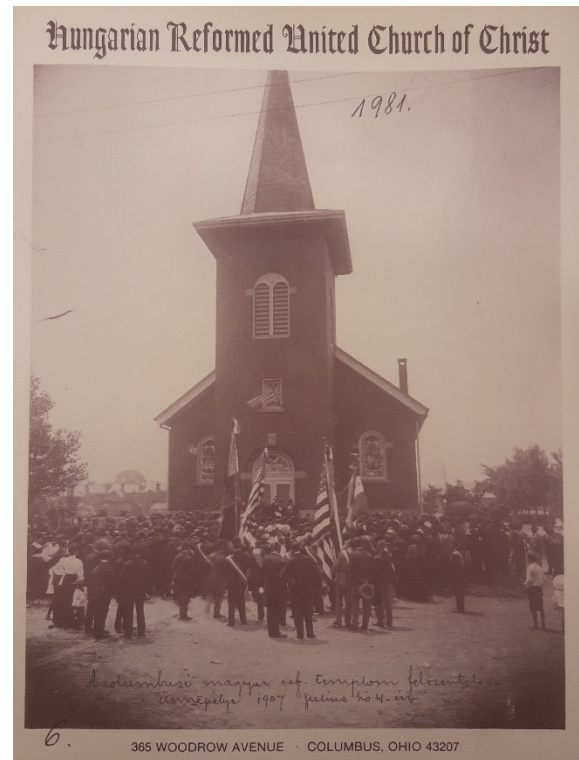
2. kép: A templom képe a 75 éves jubileumi kiadványban (lásd: 9. látjegyzet)

1939. április 2-ától a columbusi magyar egyház lelkészeként dolgozott. 8 A helyi református egyház 10. lelkészeként éppen 10 éven keresztül, 1949-ig irányította aktívan a hitéletet. Érdekesség, hogy ő volt a közösség első amerikai születésű lelkésze. 9 A columbusi magyar egyház fennállásának 75. évfordulójára, 1981-ben kiadott emlékfüzetben „fiatal és energikus” lelképásztornak írják le, aki „jelentős sikereket ért el a gyülekezet tagságának gyarapításában.” Lelkészsége idején duplájára növelték a templom udvarának méretét, utcai lámpákat állítottak fel körülötte, a templomtornyot rézzel vonták be, csúcsára rézgömböt helyeztek, az udvari illemhelyet pedig angol rendszerűre cserélték. Elfogadták a gyülekezet új alkotmányát, új, hatékonyabb módszert vezettek be a heti pénzadományok gyűjtésére, és elindították az egyház heti értesítőjét is. 10